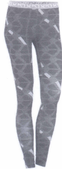
القطعة الأولى والمصممة لتغطية الجزء السفلي من الجسم